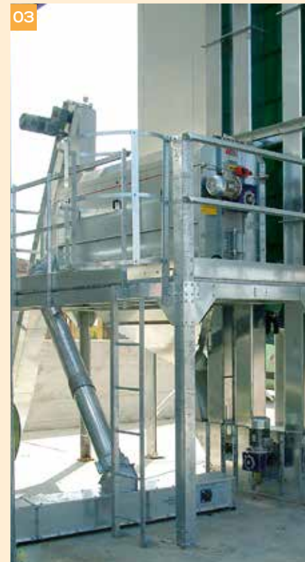
01, 02, 03 - Installations-Beispiele.