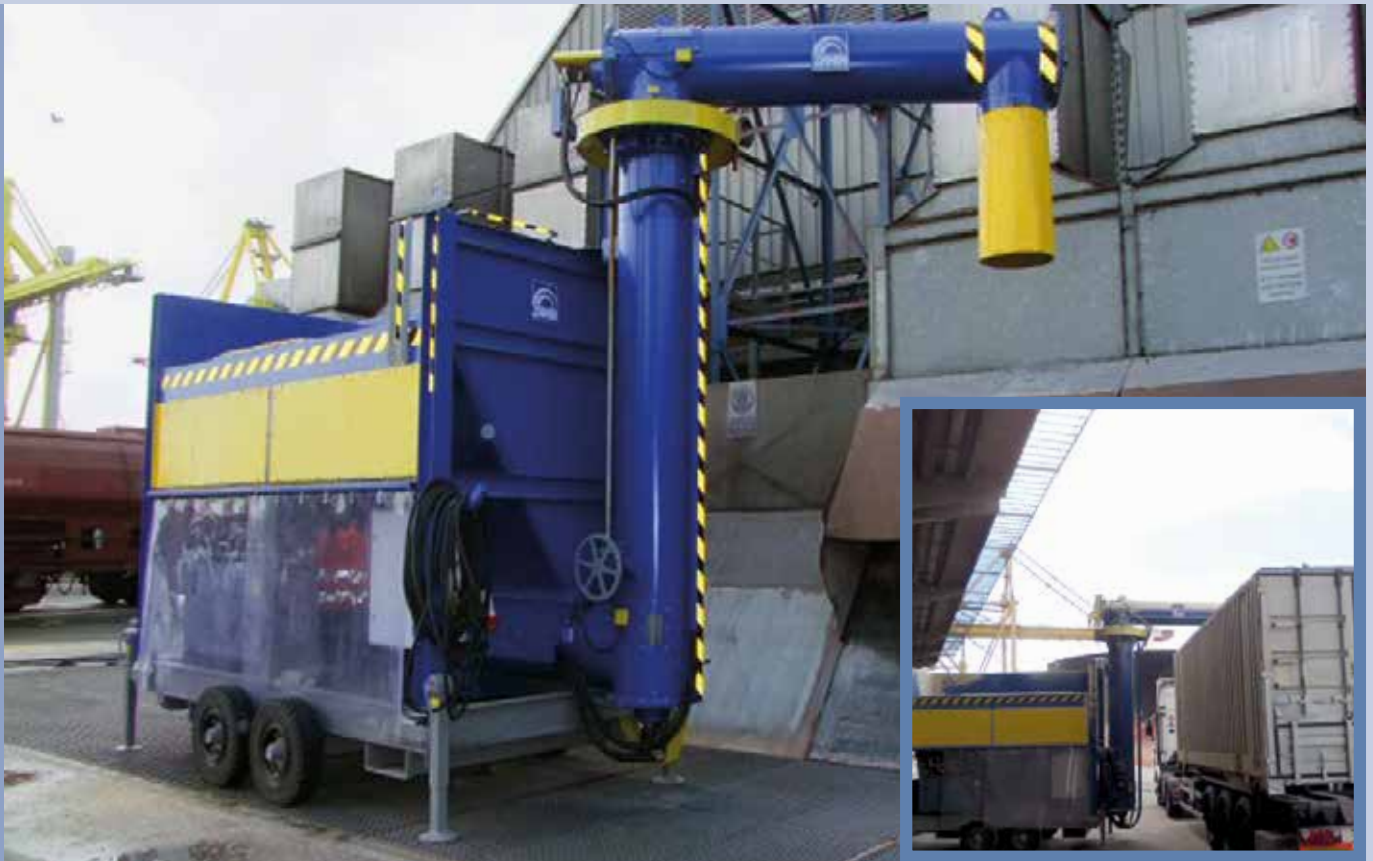
■ Wiederbeladung mit mechanischer Schaufel für die LKW-, Tank- oder Eisenbahnwagen-Beladung