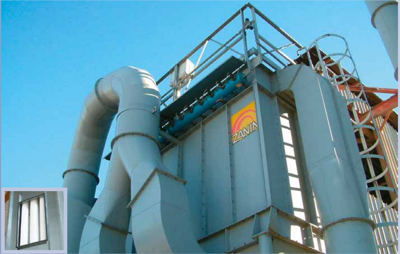
■ Selbstreinigender Filter