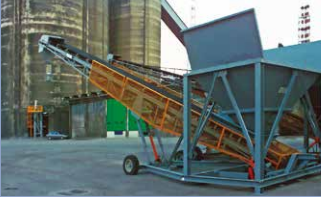
■ Beladungsband für LKW - Bahnwagen mit Trichter und kontinuierliches Wiegesystem.