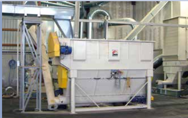
■ Anlage für Pelletproduktion