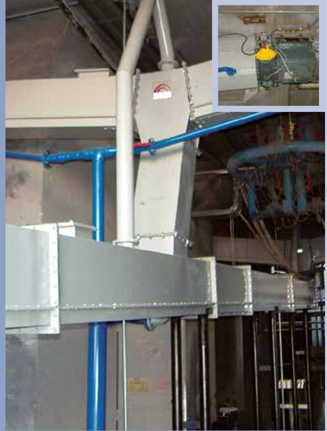
■ Verflüssigungskanäle für den Asche- und Zementtransport