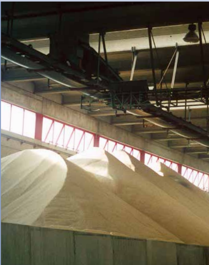
■ Lagersystem mit Bandförderer