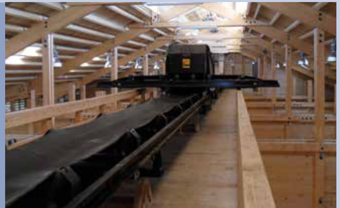
■ Beladung von Lagerzellen