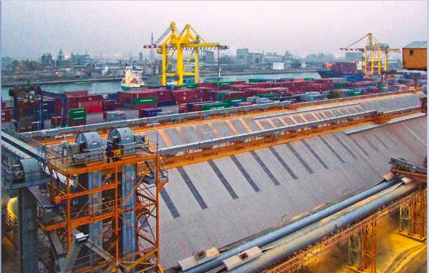
■ Anlage für die Schiffsentladung: 700 t/h