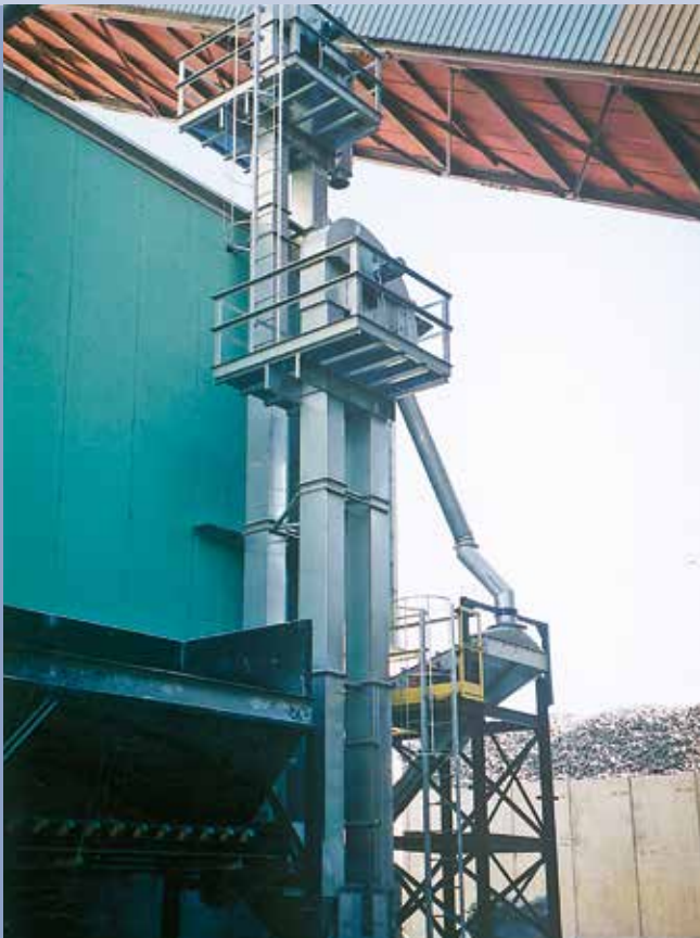
■ INOX-Elevator mit Rüttelsieb und Trichter