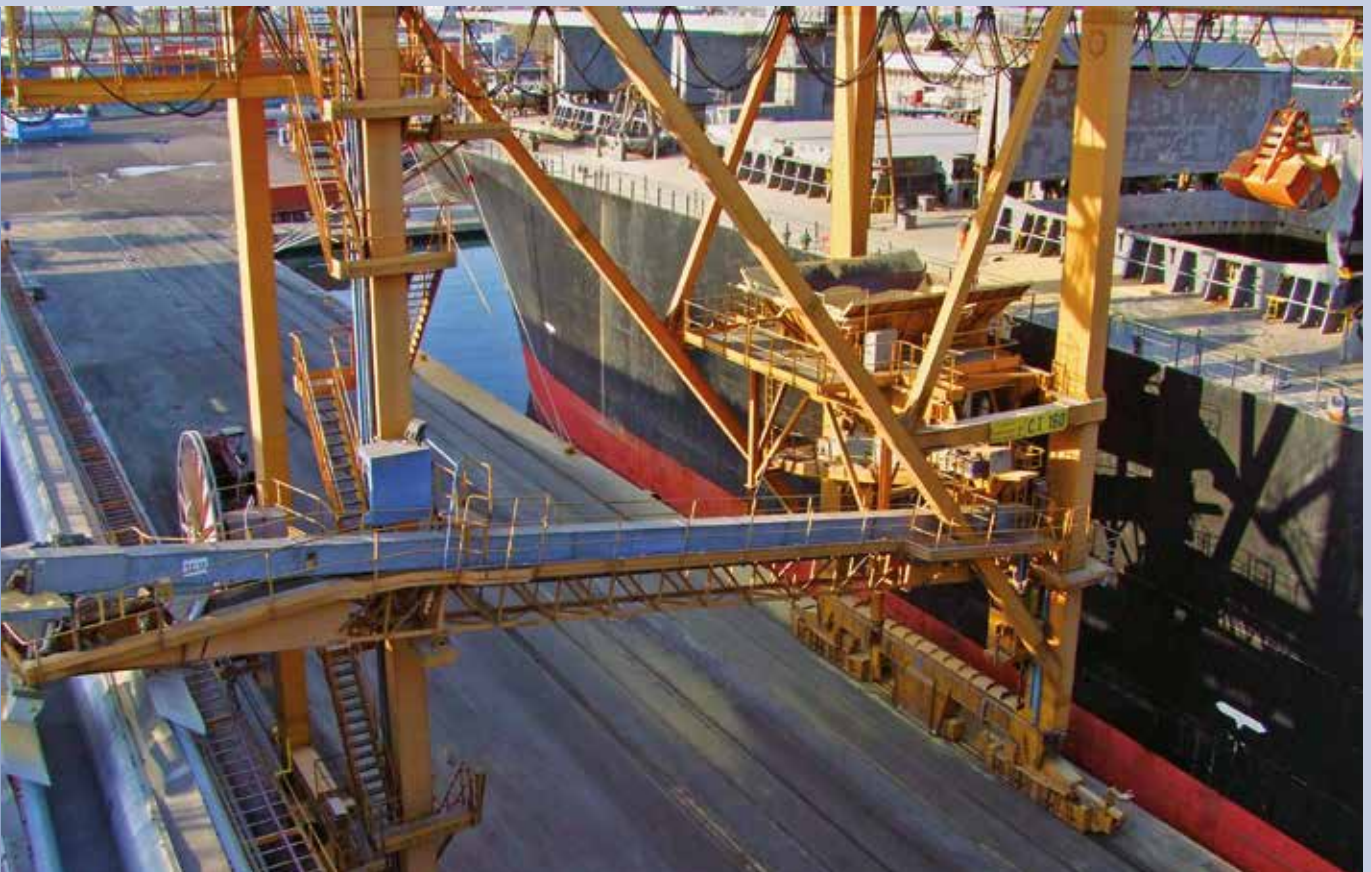
■ Ausschiffungslinien vom Schiff in Lager