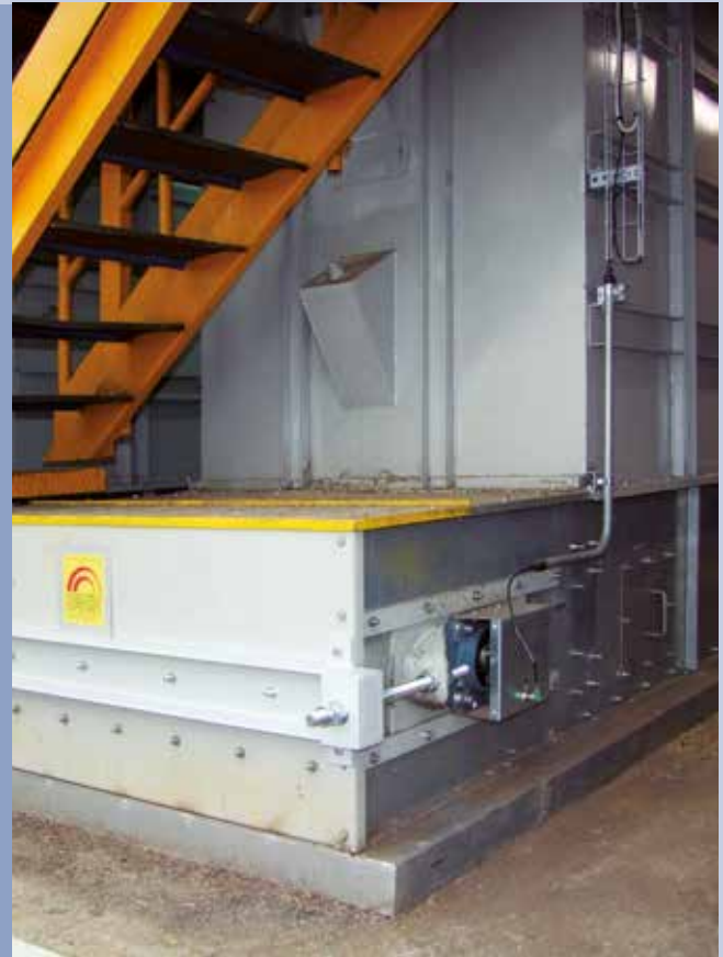
■ Wiegesystem mit kontinuierlicher Abförderung