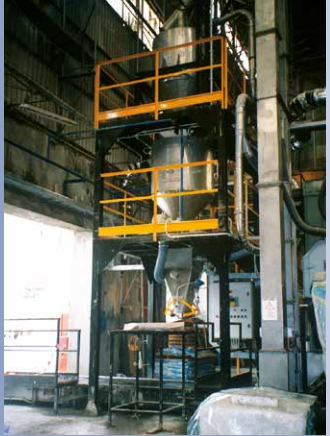
■ BIG-BAG-Verpackung als Nettogewicht