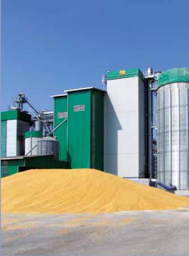
■ Trocknungsanlage für Getreide mit CR-Trockner komplett mit Kühlsystem