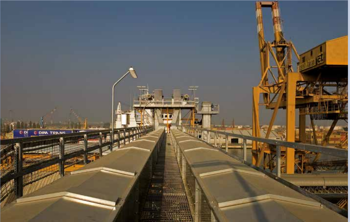
■ Becherwerk für die Beladung von Kettenförderer