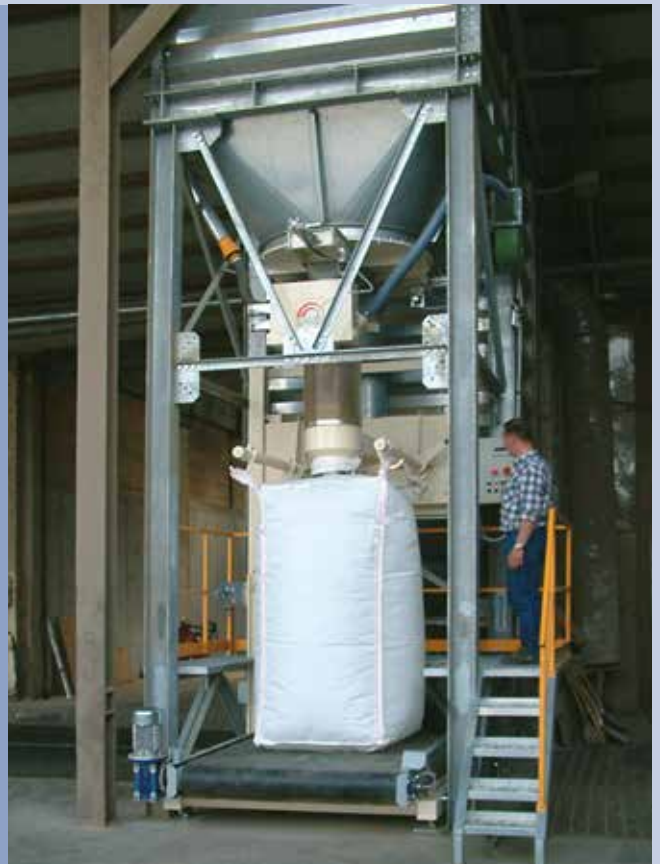
■ BIG-BAG-Verpackung als Bruttogewicht