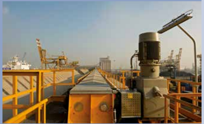
■ Kettenförderer für die Lagerbeladung