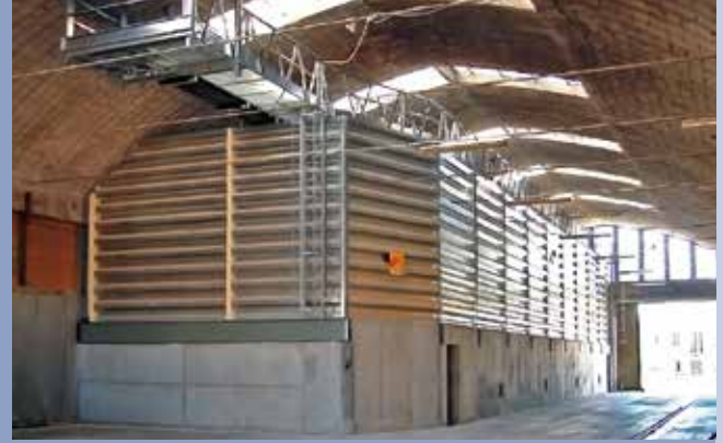
■ Quadratische Silozellen