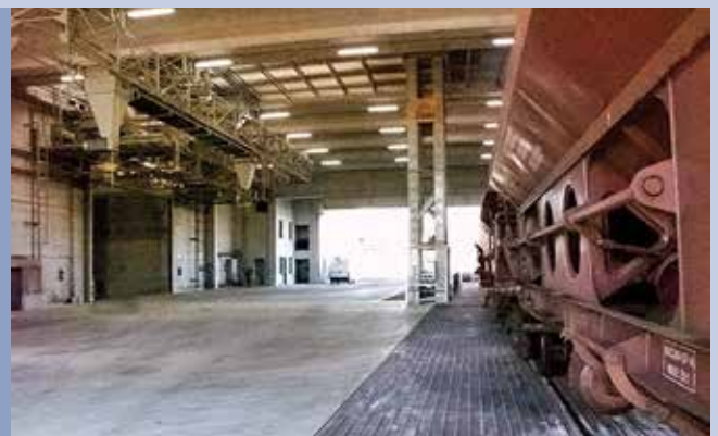
■ Bahnwagenentladung mit Waage und robotisierte Lagerzellen