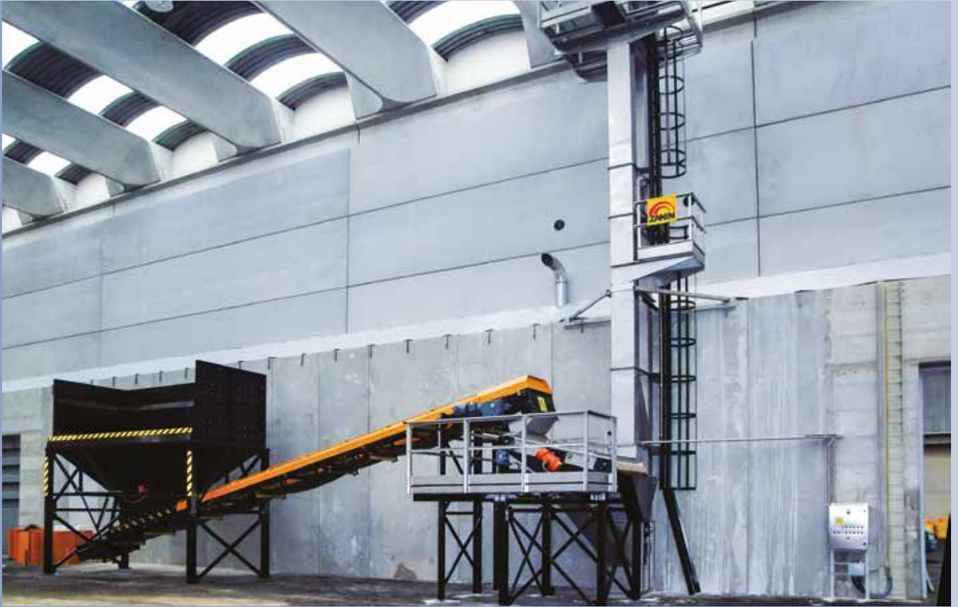
■ Verpackungssystem für Düngemittel