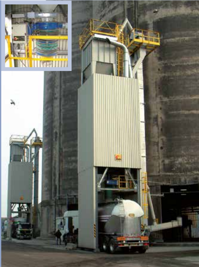
■ Anlage zur Wiederbeladung