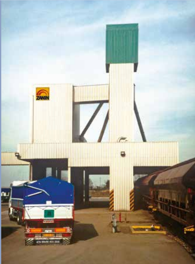
■ Empfangssystem mit Schnellbefüllung und Förderer für die LKW-Entladung