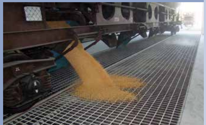
■ Eisenbahnentladungsphase in Trichter