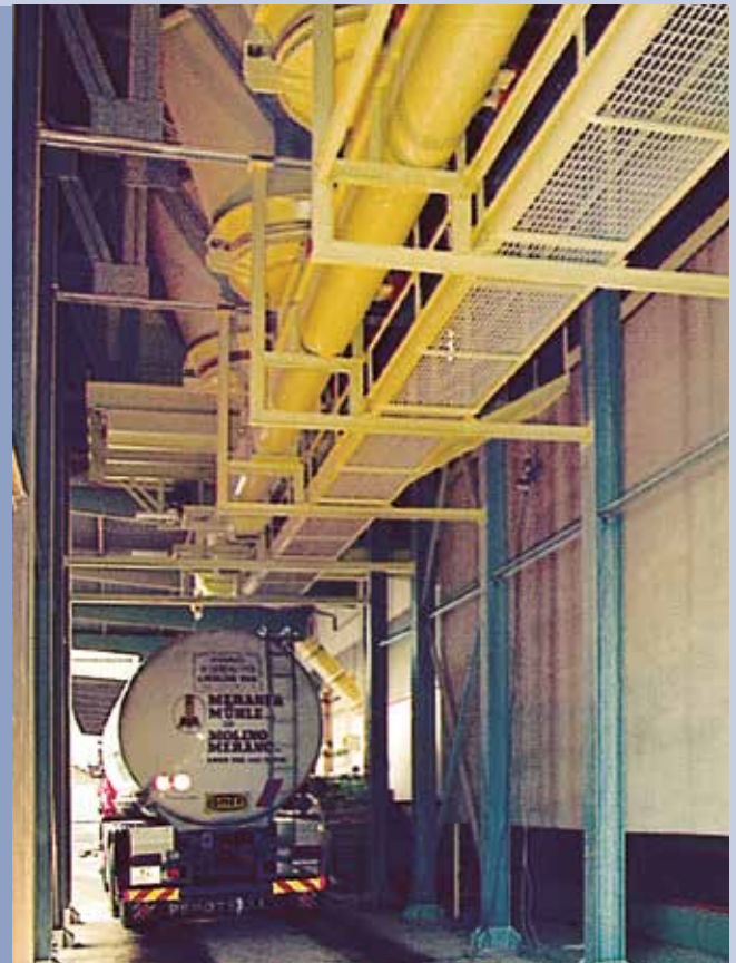
■ Schnellbeladung mit Produktmischung