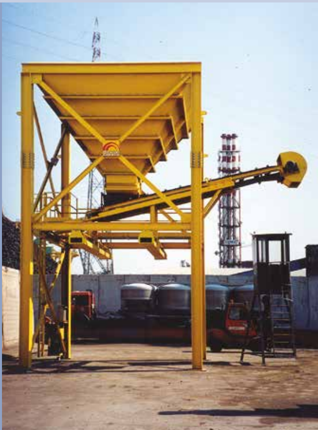
■ Trichter mit Förderband für die LKW-Beladung oder Eisenbahnwagen