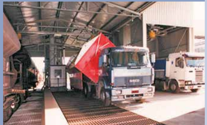
■ Wiegetrichter für Eisenbahnwagen mit Trichter für LKW mit hydraulischem Kipper