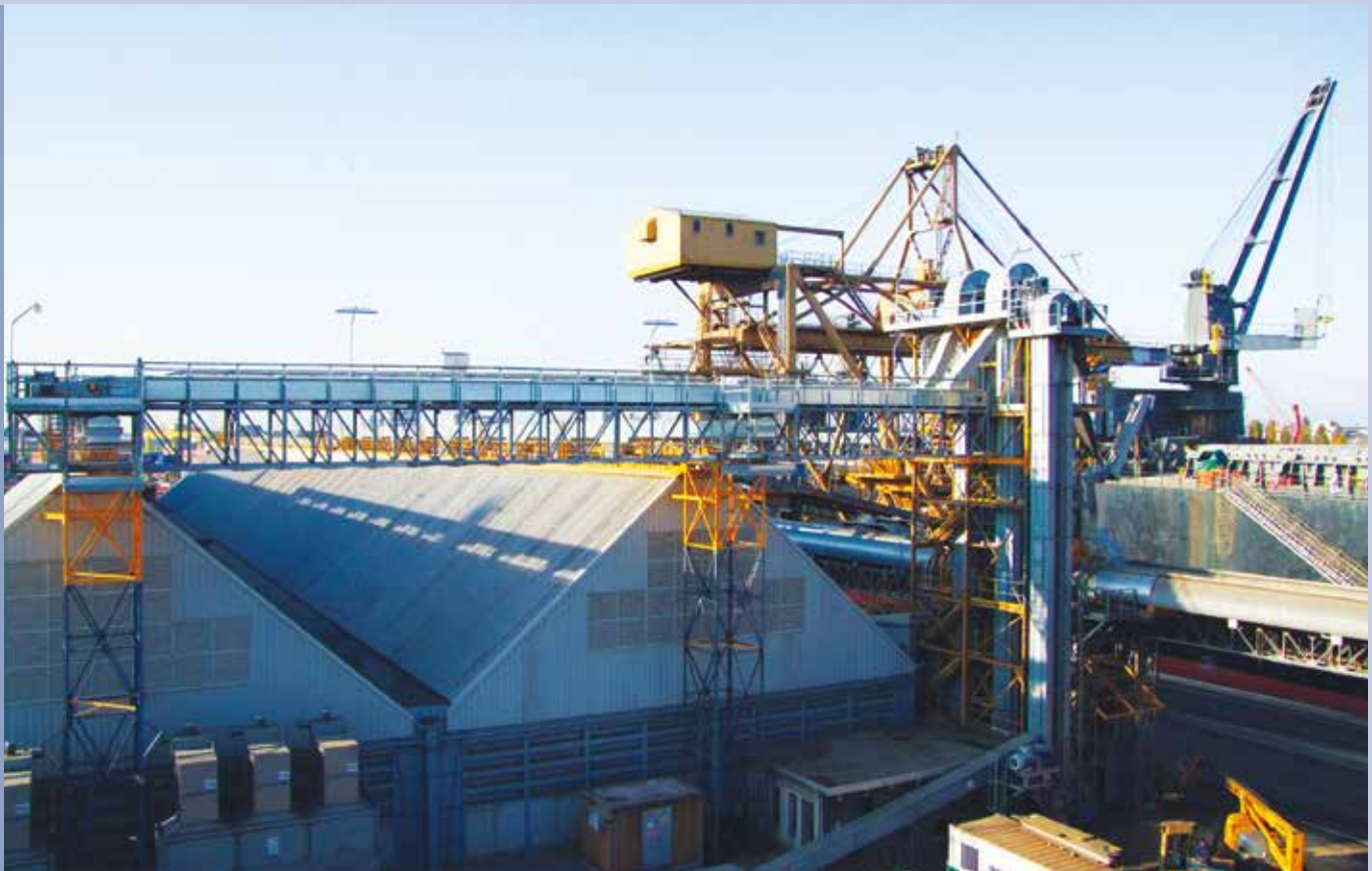
■ Förderer zur Lagerbeladung