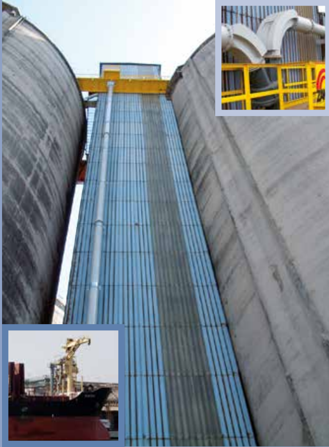
■ Beladung pneumatischer Förderer vom Schiff in Silos, Höhe 60 m