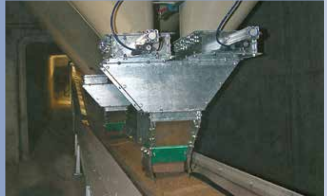
■ Entladungsphase aus Silo in Silozellen