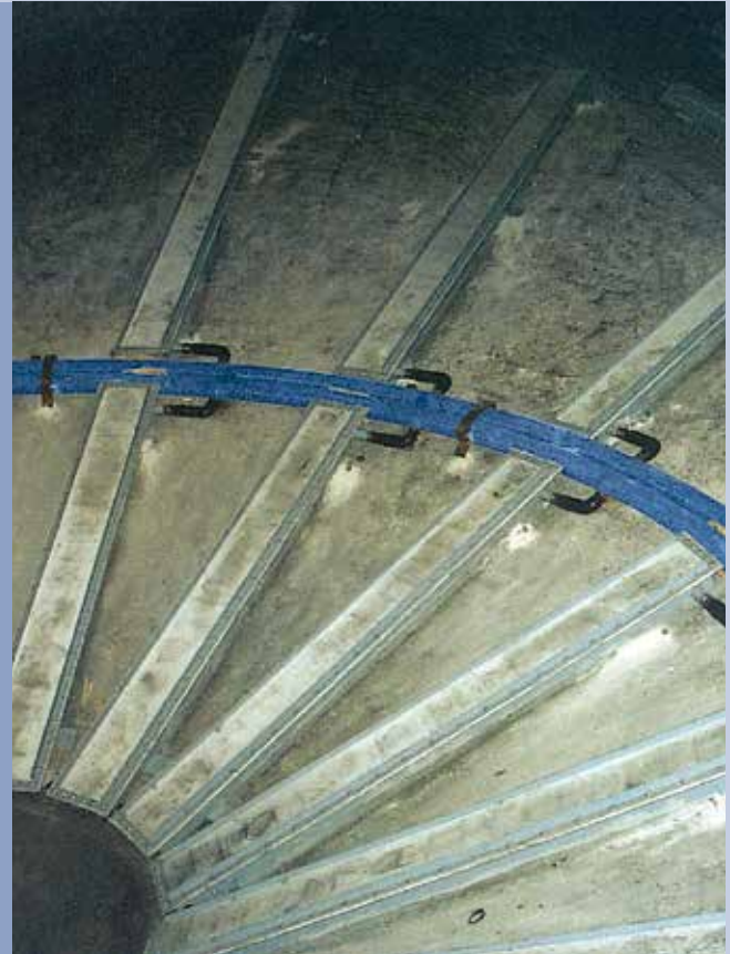
■ Verflüssigungskanäle für Silokonus