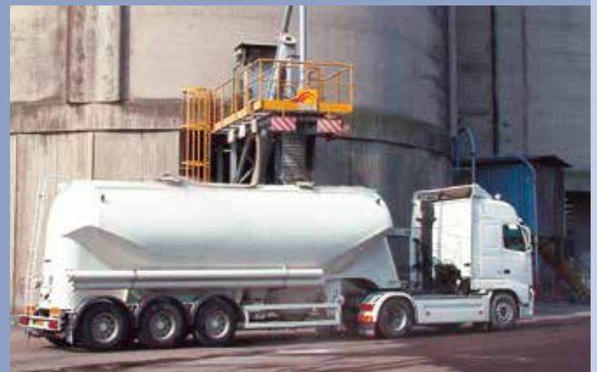
■ Produktpedition von Staubprodukten mit Wiegesystem