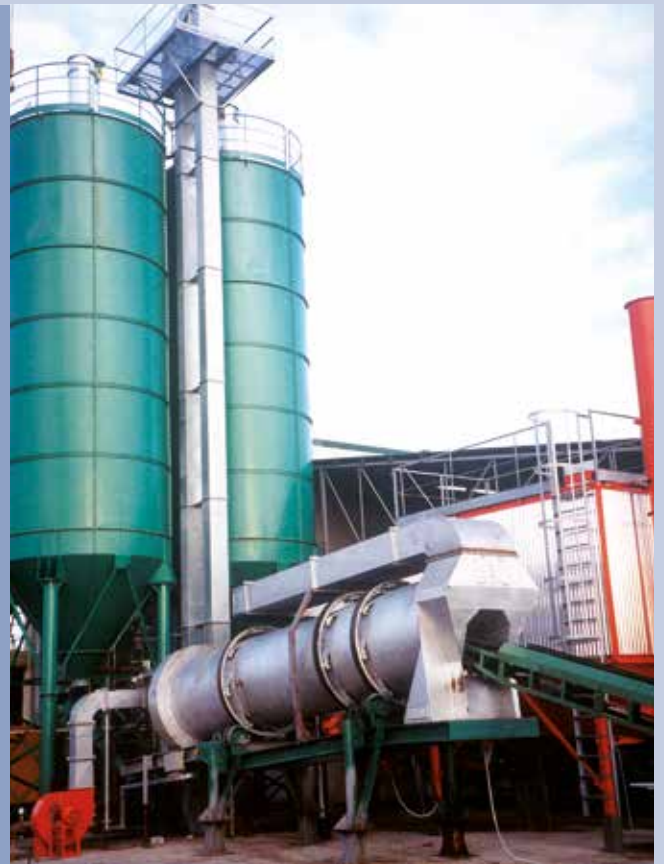
■ Becherwerk für Sandprodukte