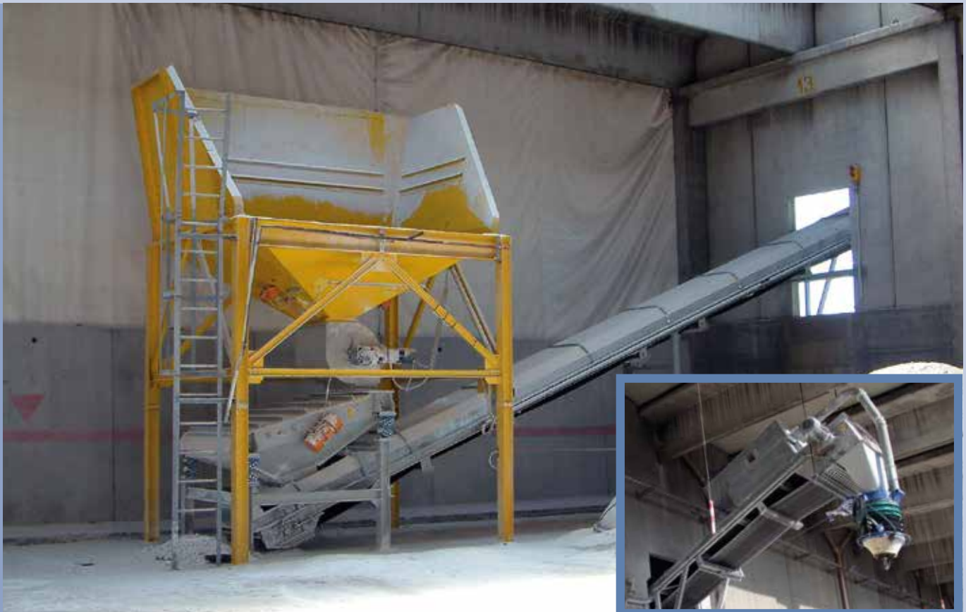
■ LKW-Wiederbeladung mit Siebeinheit