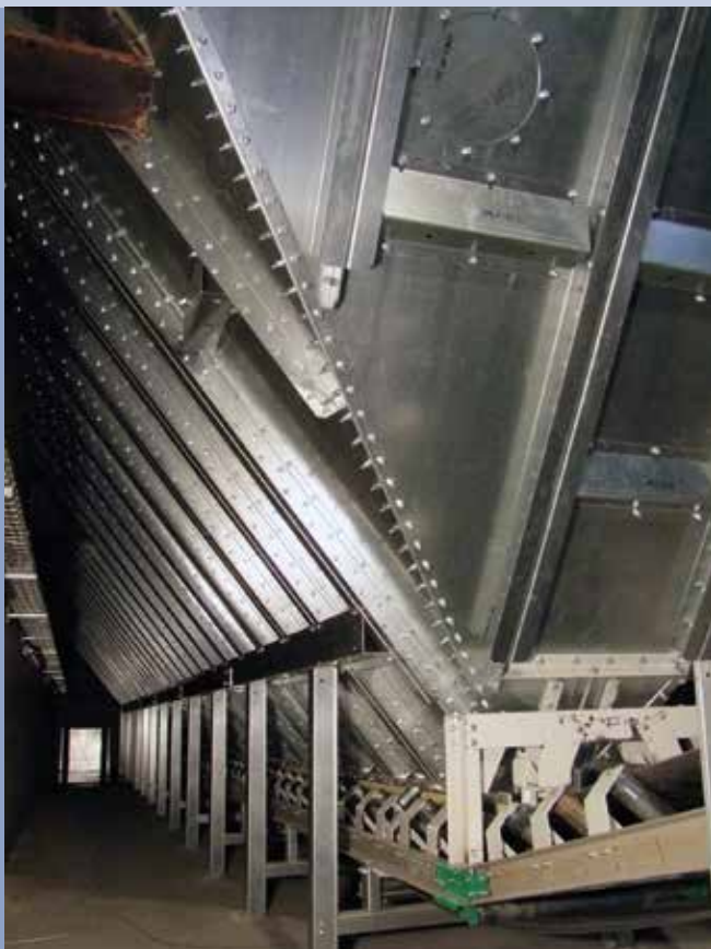
■ Eisenbahn-Wagenentladung in Trichter